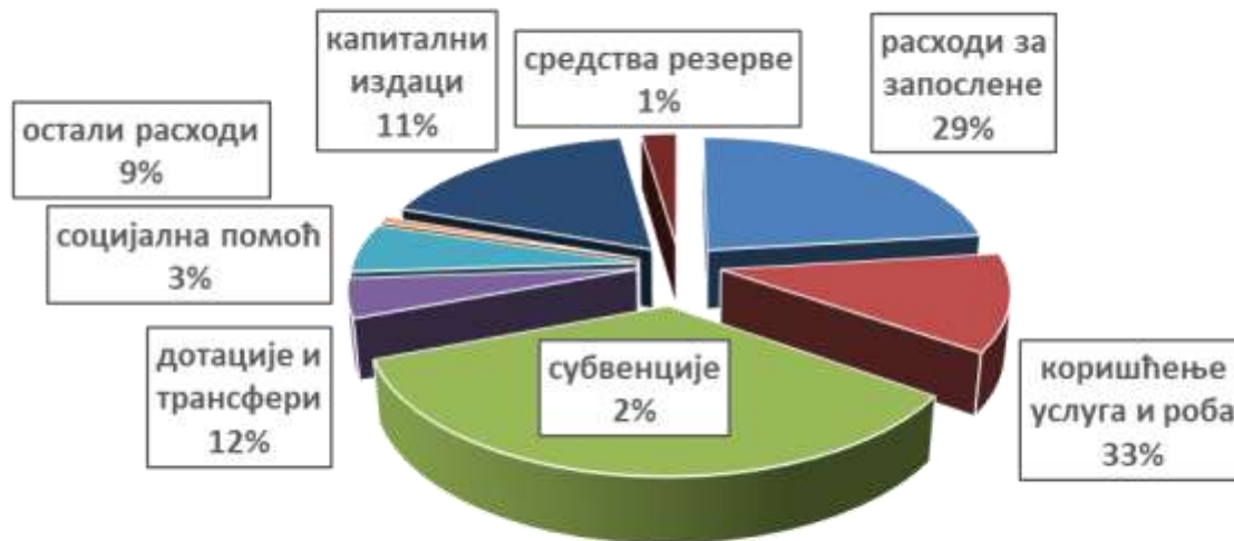
Структура расхода и издатака